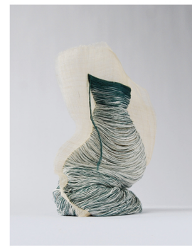
Pushing Embroidery Emilia Elfvik emiliaelfvik.com @eelfvik