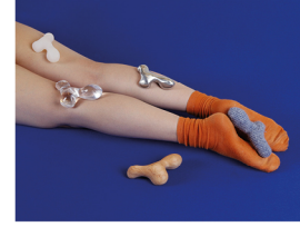
R.O.S.P - Ritual of Sexual Pleasure Coby Huang cobyhuang.com @cobyhuang_kerby @studiocoby