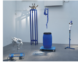
ALIEN WORRIOR PRINCESS Mattias Pettersson @ma.tt.ia.s.pe.tt.er.ss.on