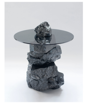
Coal:Post-Fuel // A New Social Relation Jesper Eriksson jesper-eriksson.com @m.jesperiksson