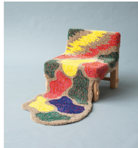
Ryafätölj Oscar Wall oscarwall.se @larsoscarwall Kvadrat stipendiat/scholar