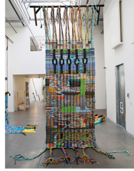
Ängsliga mattor Gustaf Helsing gustafhelsing.se @ghelsingg