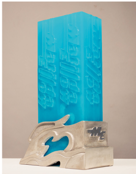
SELF TITLED Matilda Ström Ellow matildasellow.cargo.site @msellow