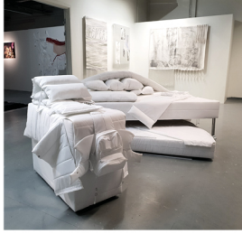
Puffer-jacket-soft-squad, pure sculpture! Sara-Lovise Ewertson sara-lovise.com @sara.lovise