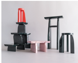
Mix Sushi Mattias Selldén @studiomattiasellden