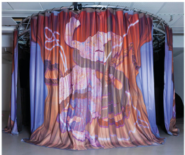
DESIRE_LINES Kitty Schumacher @kittyschumacher